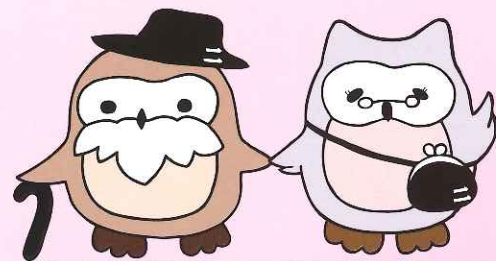
高齢者・障がい者総合支援センター「ゆとり～な」公式キャラクター ゆ～とさん り～なさん