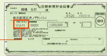
定額郵便貯金証書（例）