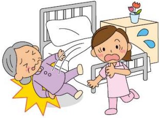
(業務遂行に起因する身体障害)