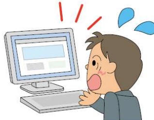
(プライバシーの侵害による人格権侵害)

5 作成したケアプランの内容や提供したサービスの内容が誤ってホームページに掲載され、利用者のプライバシーを侵害してしまった。