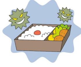
(生産物に起因する身体障害)