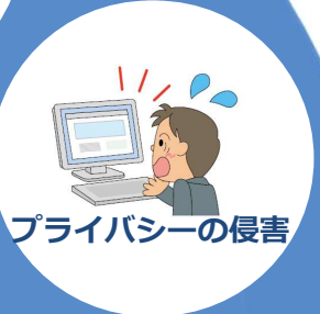
プライバシーの侵害