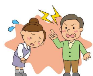
(身体障害・財物損壊を伴わない経済的損失)

6 依頼されていた要介護認定の申請代行を失念し、利用者が自己負担したことにより、賠償請求を受けた。